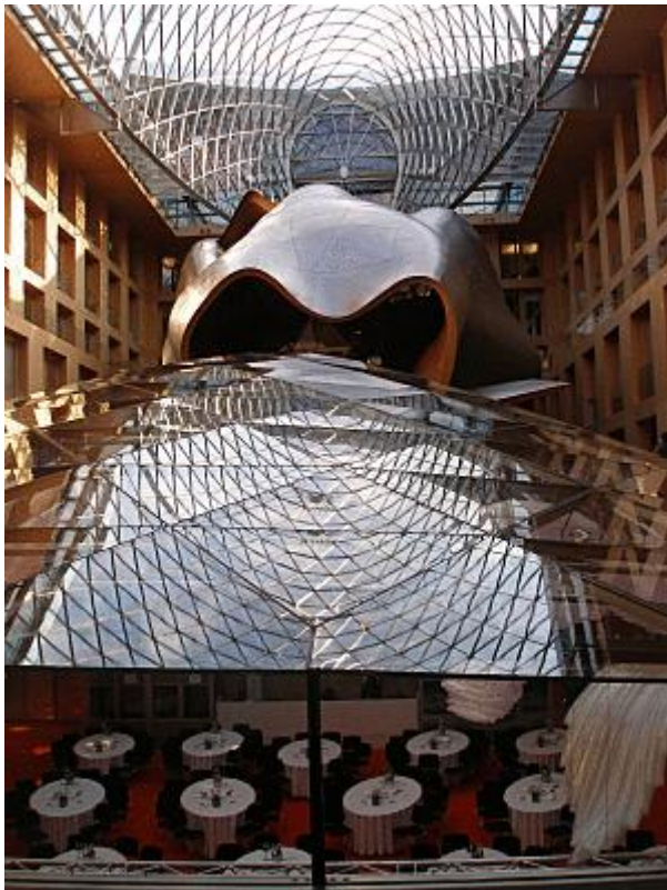
How to make a gif

A lista de efeitos é vasta e o resultado obtido em minutos e este site pareceu-nos ser também o que se sai melhor no uso das ferramentas tradicionais, fornecendo imagens de qualidade superior (como se pode constatar pela imagem reproduzida abaixo), que depois de prontas pode ser partilhada nas redes sociais (Facebook, Twitter, Orkut, Google +) ou integrada no HTML de uma página, por exemplo.